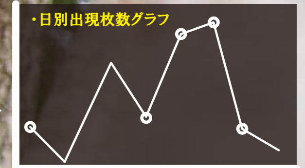
ポイント (ステップ4) 資料作成時間の大幅削減!!