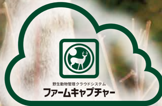
(ステップ2) クラウドへデータ受信、データの整理