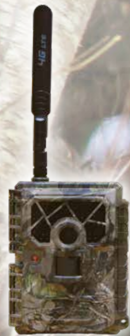
(ステップ1) センサーカメラが撮影・送信

ファームキャプチャーとは? センサーカメラで撮影された静止画がクラウド上に送信されます。これにより遠隔地からでもデータの確認が可能。パソコンだけでなく、スマートフォンやタブレットでも確認できます。さらに蓄積されたデータを素早くグラフやヒートマップなどに可視化。従来はデータ採取や集計に多くの時間や労力が費やされましたが、これにより時間やコストを大幅に削減することができ、地域の獣害、農作物被害対策を迅速に講じるための資料が素早く作成できます。