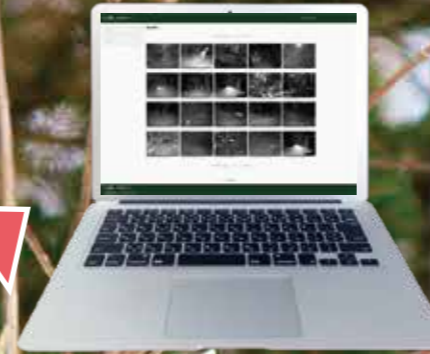
(ステップ3) PC、スマートフォンで確認